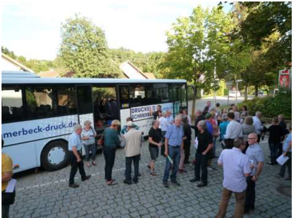
Rundgang Ortsmitte Tiefenbach