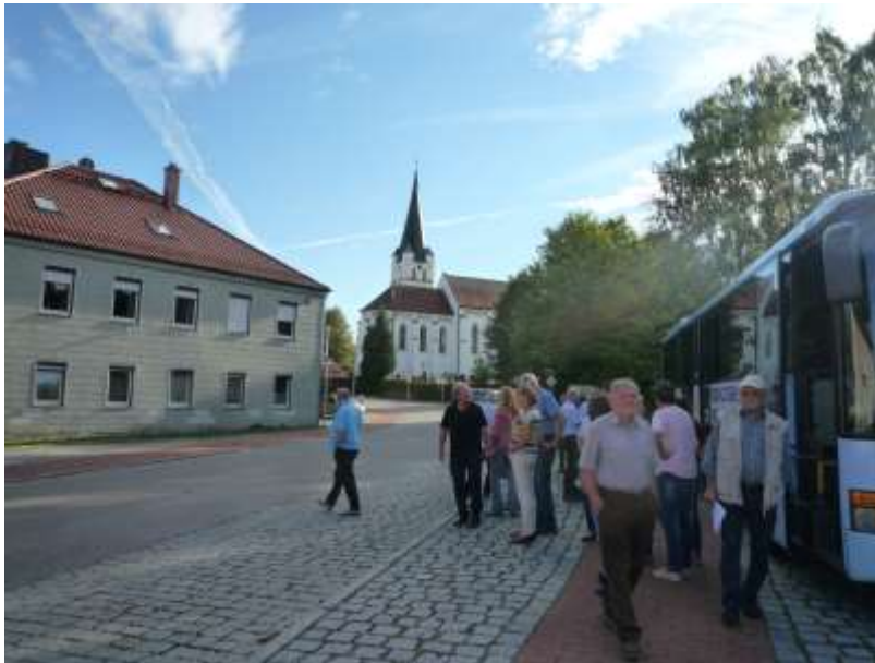
Zwischenstopp Ortsmitte Ast