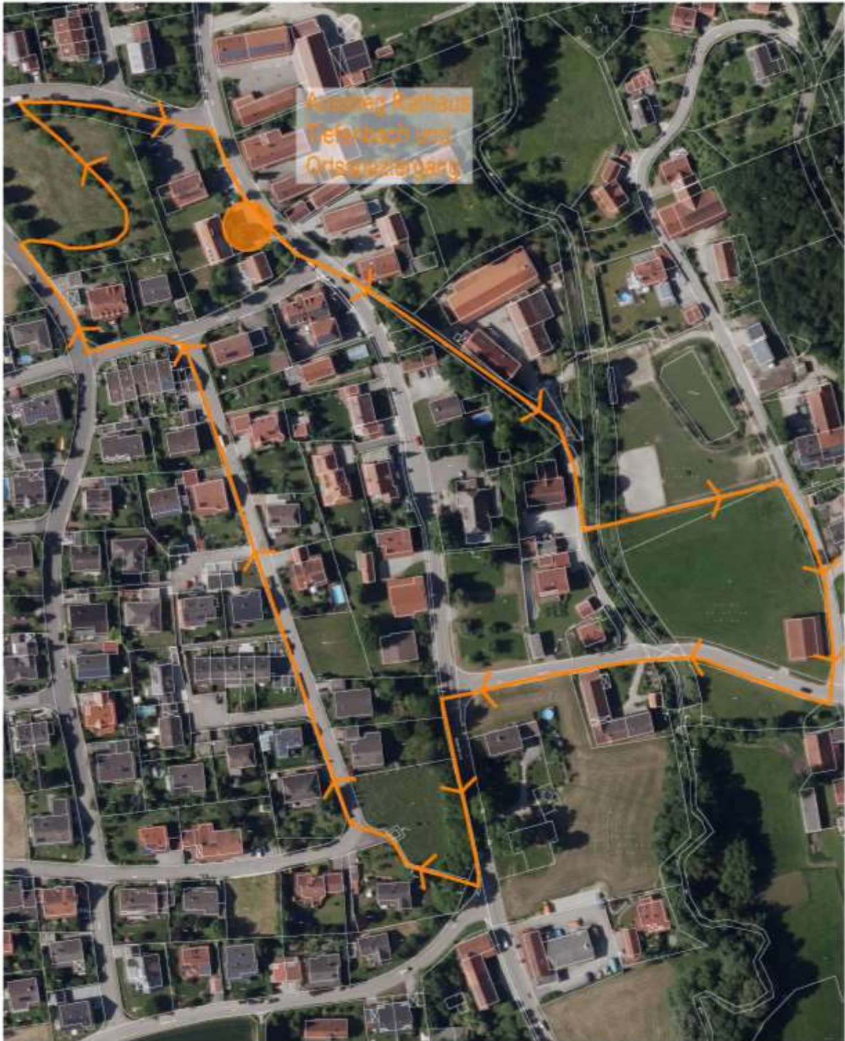
IOEK TIEFENBACH - Ortsbegehung am 16.09.2015