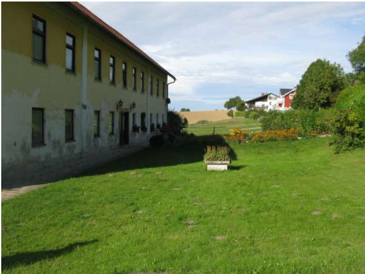
Rundgang Badhaus Ast