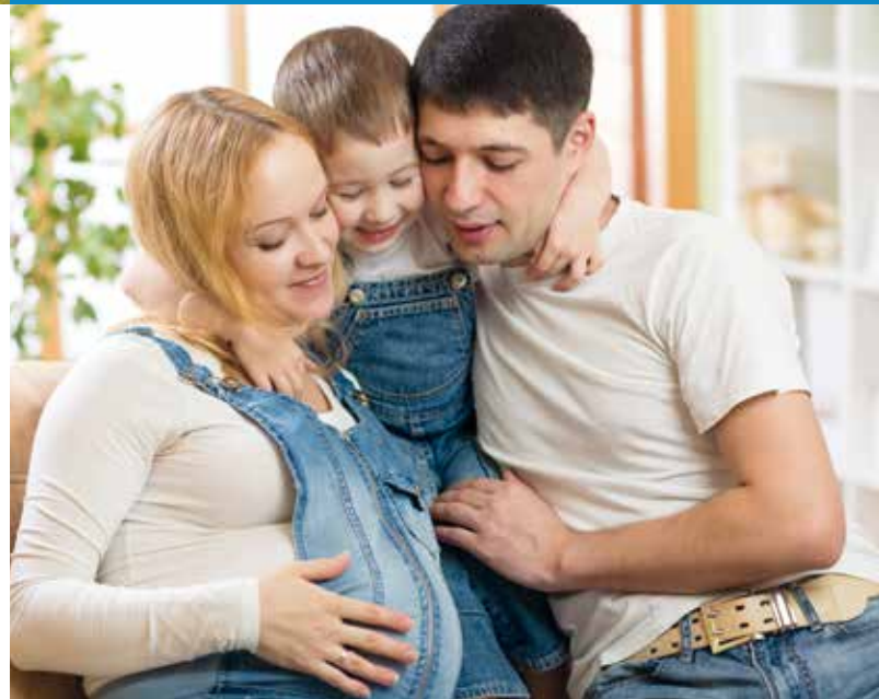
Stand: 12/2015